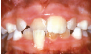
MORDIDA CRUZADA ANTERIOR

Maloclusiones (“malas mordidas”) ilustradas en esta página, pueden beneficiarse con un diagnóstico temprano y ser referidos a un especialista en ortodoncia para recibir una evaluación completa.