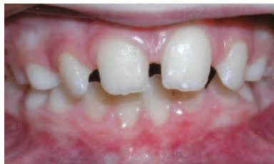
ESPACIOS ENTRE LOS DIENTES

Los dientes de la arcada inferior están por delante de los superiores cuando los dientes posteriores están en contacto