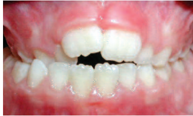
MORDIDA CRUZADA POSTERIOR

Dientes de arriba se encuentran por detrás de los de abajo