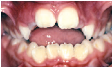
MORDIDA ABIERTA ANTERIOR

Poco espacio para los dientes permanentes