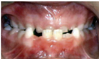
MORDIDA ANTERIOR CRUZADA

Los dientes de la arcada inferior están por delante de los superiores cuando los dientes posteriores están en contacto